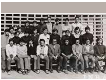
Fotografía del 4 to B

Después se inicia la gran aventura de los estudios superiores. Por las enseñanzas recibidas en nuestro querido colegio, las supimos afrontar con éxito para transformarnos en profesionales gracias a la