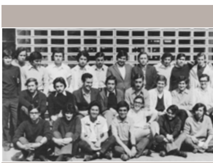
Fotografía del 4 to G