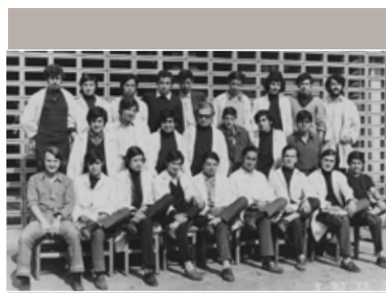
Fotografía del 4 to C

Vienen a mi memoria los paseos y viajes de fin de año, los esfuerzos que se hicieron para la inolvidable gira de estudio a Argentina, junto a nuestro maestro Max González, las tardes de cine de los miércoles en nuestro propio teatro, las áreas de deportes en el patio amarillo y las canchas de fútbol, así como a los grandes basquetbolistas del colegio. La historia continúa y nos fuimos transfor-