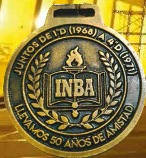
Medalla conmemorativa por los 50 años de egreso Generación 1971

He recibido un mandato inesperado para comentar en pocas palabras la experiencia de la generación del 71 en el INBA. Han pasado 50 años desde el final de nuestra etapa de la enseñanza media y nuestras mentes aún recuerdan cuando llegamos por primera vez al internado, encontrándonos ante nuevos desafíos. Muchos lo hicimos desde provincia, con temor a lo desconocido, pero con muchas ansias de aprender y crecer como seres humanos para poder enfrentar todos los desafíos de la vida con mejores armas y con el apoyo de nuestros hermanos. El Alma Mater nos recibió como niños.