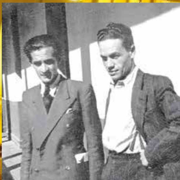
1935 Los inspectores del INBA Jorge Millas y Nicanor Parra

Vaquero, Indio, Cocoliso, Mexicano, Popeye, Moro, Gallinazo, Pulento, Burro, Perro, Vampiro o Turnio. Apodos como estos, unos más cariñosos que otros y siempre clandestinos, adornaron por años los nombres de los inspectores universitarios, figuras inconfundibles en las salas, patios, comedores y dormitorios del INBA.